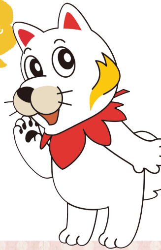
広島広域都市圏マスコットキャラクター ひろしま都市犬はっしー